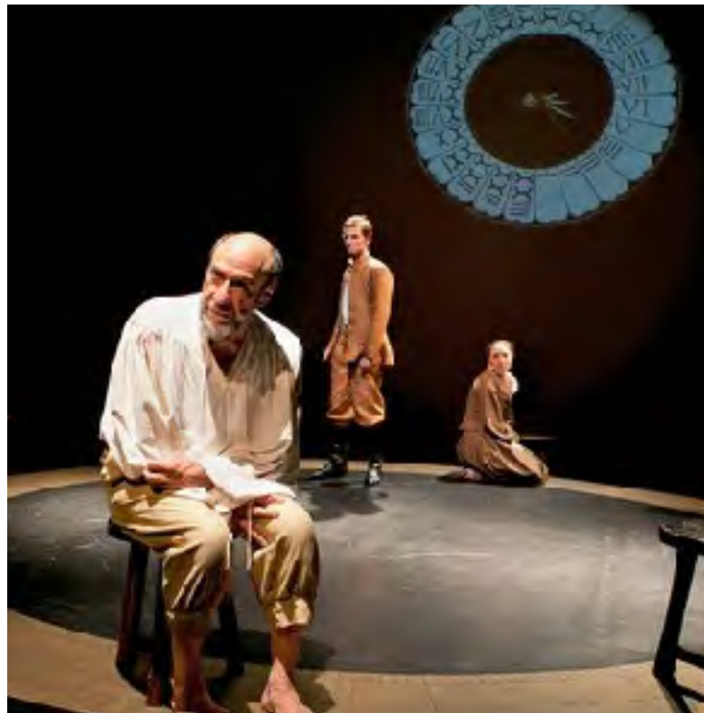
브레히트, 〈갈릴레오의 삶〉 베이컨, 〈새로운 아틀란티스〉